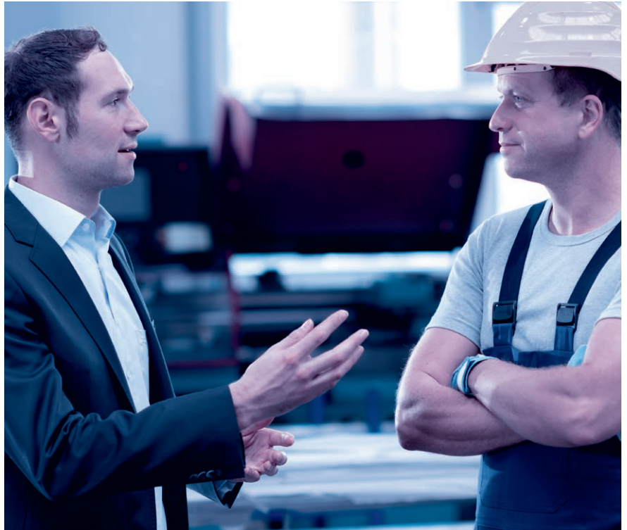
Das Mitarbeitergespräch ist keine Nebensache. Nehmen Sie sich Zeit und hören Sie zu.

Sinnvollerweise wird für das Mitarbeitergespräch zudem ein über die Jahre gleichbleibender Beurteilungsbogen mit einer Bewertungsskala (mit Smileys, Ampeln, Zahlen oder Buchstaben) verwendet.